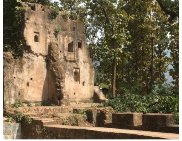
मणिमुकुन्द सेनको शितकालीन दरबारको भग्नावशेष