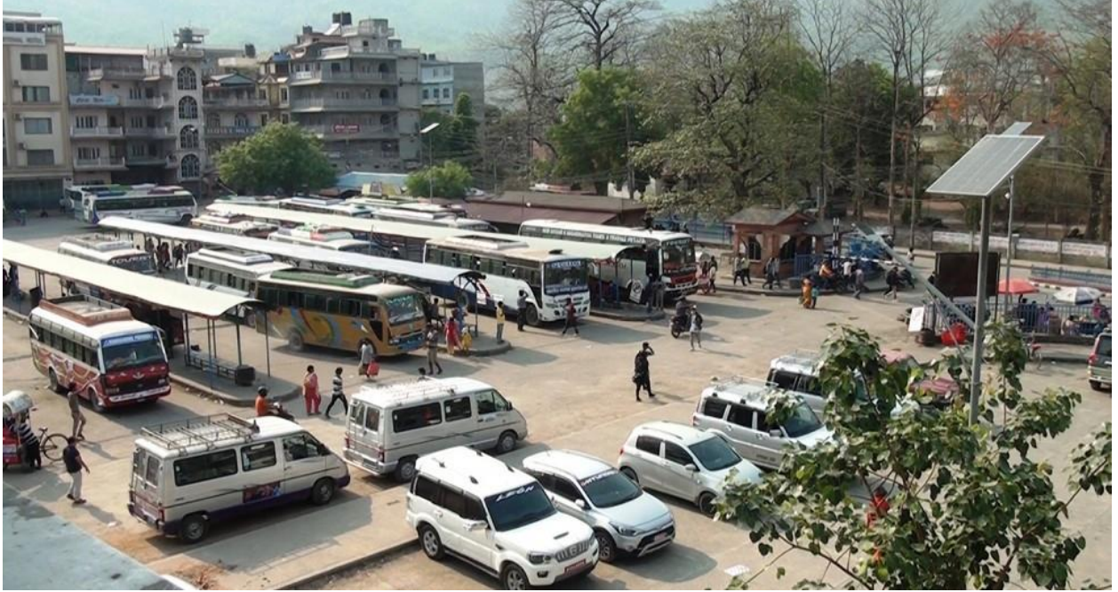
Butwal Bus Park Class 3 , page no 9