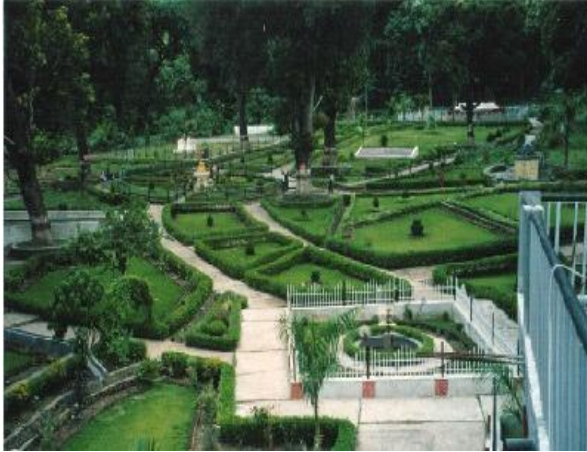
Manimukunda Sen Park