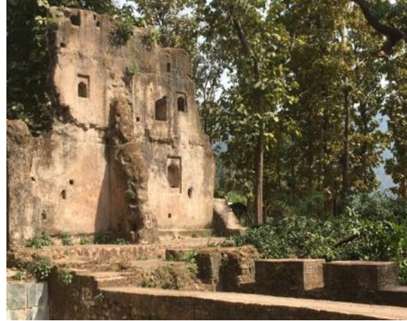
Remains of winter palace of Manimukunda Sen